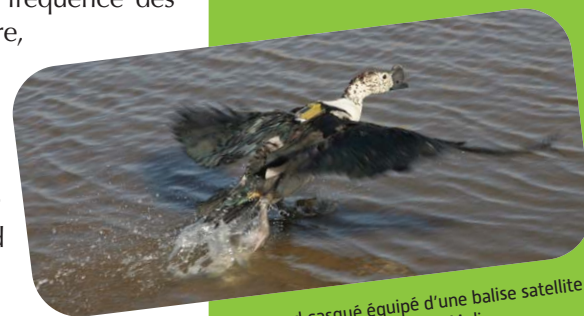
Canard casqué équipé d'une balise satellite dans le delta du Niger au Mali.